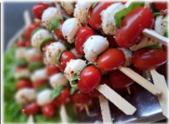
Preisliste Nr. 112