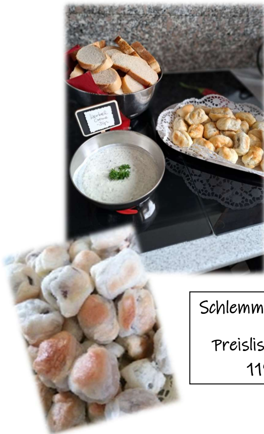
Schlemmer-Balls Preisliste Nr. 118