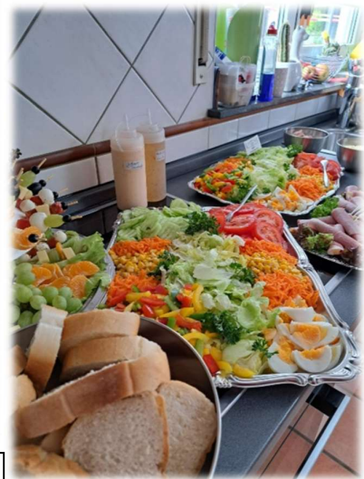
Gemischte Salatplatte Preisliste Nr. 113