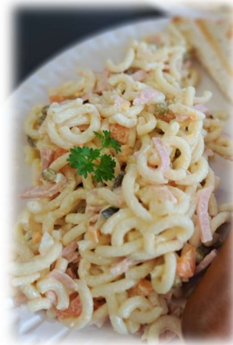
Nudelsalat Hauseigene Rezeptur Preisliste Nr. 116