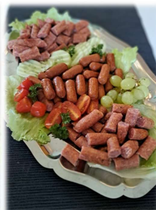
Fingerfood- Wurstplatte Preisliste Nr. 105