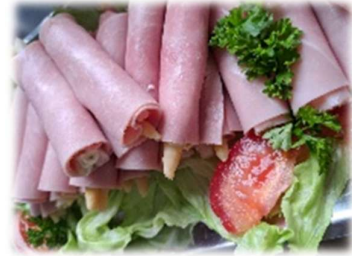
Mini-Schinkenröllchen Preisliste Nr. 111