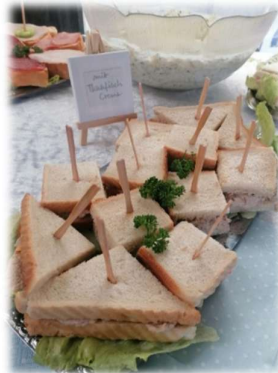
Mini-Sandwich 1/4 Preisliste Nr. 101