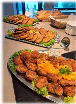
Party-Frikadellen Preisliste Nr. 104