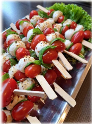
Mozzarella- Tomaten- Spieße mit Basilikum